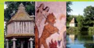
12 ALLEMANS DU DROPT MEDIEVAL VILLAGE