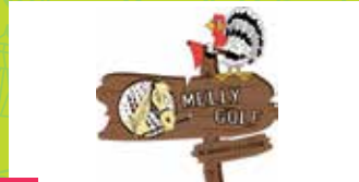
21 MELLY'S MINI GOLF