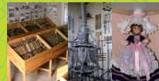
9 MUSEUMS OF SOUMENSAC