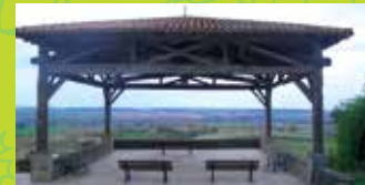
5 MONTETON MÉDIÉVAL VILLAGE - POINT OF VIEW