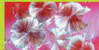
11 POTTERY AND CRYSTALLIZATION WORKSHOP