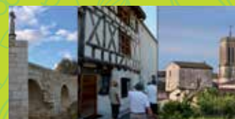
14 LA SAUVETAT DU DROPT MEDIEVAL VILLAGE