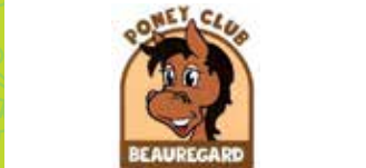
22 PONEY CLUB BEAUREGARD

« WINE ROAD » 50 PRIVATE WINE CELLARS AND COOPERATIVE WINERY BERTICOT TO VISIT