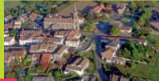
17 BASTIDE OF LÉVIGNAC DE GUYENNE