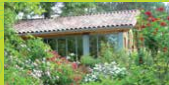
3 BOISSONNA GARDEN TEA ROOM