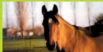
8 ECURIE DU DROPT