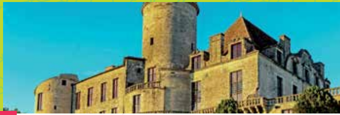
1 CHÂTEAU OF DURAS AND MEDIEVAL VILLAGE

« WINE ROAD » 50 PRIVATE WINE CELLARS AND COOPERATIVE WINERY BERTICOT TO VISIT