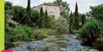
24 GARDEN SARDY