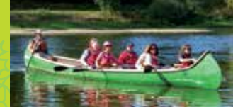
24 RAMBLE ALONG THE WATER IN RABASKA CANOE