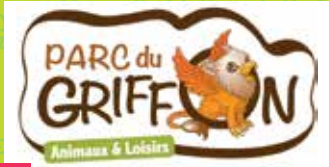
23 PARC DU GRIFFON : ANIMALS AND LEISURE PARK