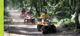
22 MOTO SPORT LOISIRS

DISCOVER THE Pays de Duras in the middle of the Dropt River Valley from sites to sites www.paysdeduras.com