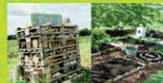
16 SIMPLY PERMACULTURE