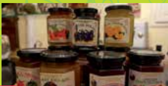
3 LA P'TITE CONFIOTE ARTISANAL JAM