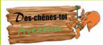
19 DES-CHÊNES-TOI AVENTURE : CLIMBING IN TREES