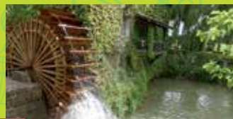
4 COCUSSOTTE MILL