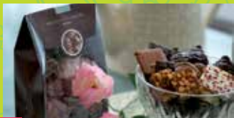
10 MAISON GUINGUET