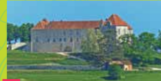
18 CHÂTEAU OF THÉOBON