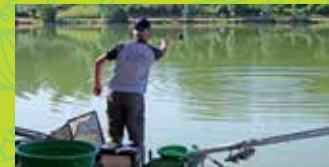
6 LESCOUROU LAKE : HIKING & FISHING