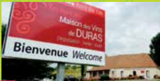
2 WINE HOUSE