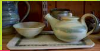
7 BONJOUR LA POTERIE