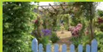
15 MIREILLE'S GARDEN