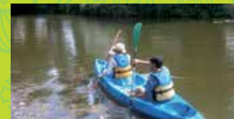
13 CANOË KAYAK