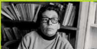
7 MARGUERITE DURAS SHOWING