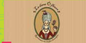
20 DAME Ô FLEURS SEAMSTRESS