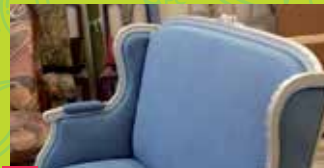
7 L'ATELIER DE SOPHIE